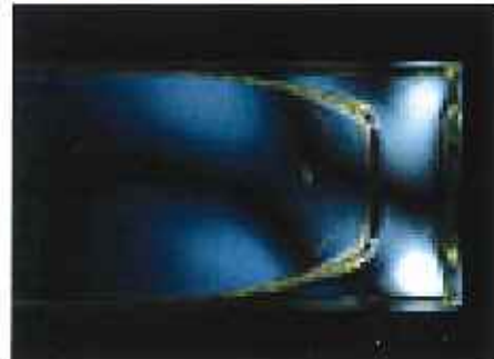
直行ニコル ガラス