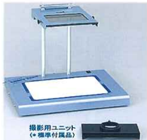
撮影用ユニット (※標準付属品)

広視野A4サイズの広い偏光ライトステージと大きな観察窓で、アクリルやポリカーボネートなどの樹脂、TACやPETなど化成品、樹脂フィルム、ガラス製品など様々な検査対象の歪みをらくらく観察ができる、新開発お勧めの偏光ひずみ検査装置です。